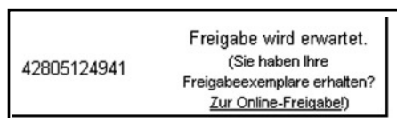
Abb. 9 Freigabeerteilung im Kundencenter

Die Freigabe kann deshalb auch Online im Kundencenter erledigt werden. Ist ein Werk zur Freigabe offen, so ist im Kundencenter unter diesem Auftrag ein Link „Freigabe erteilen“ verfügbar (Abb. 9). Klicken Sie diesen an, um die Onlinefreigabe zu erteilen.